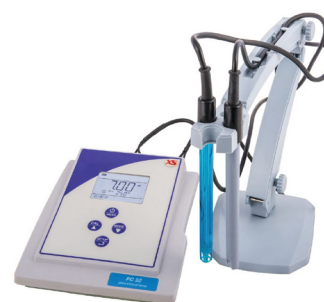
Multiparamétrico: PC52 Precio PVP: 683 €