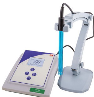
pH: pH50+ Precio PVP: 399 €

Nuevo equipo básico, el mejor en prestaciones y precio. Es el equipo de sus características con mejor precio del mercado. Pantalla retroiluminada, brazo articulado, máximo rango y precisión de su gama. Conexiones estándares, indicador de patrones, tampones, estándares y personalizables.