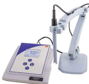
Conductividad: COND 51+ Precio PVP: 499 €